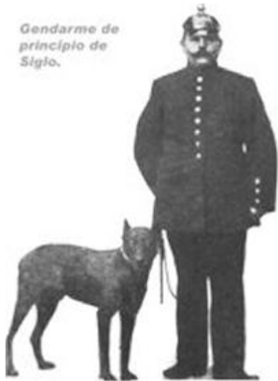
Gendarme de principio de Siglo.

En un principio era posible que se utilizara un mismo nombre para más de un perro y que éstos pudieran estar inscriptos en varios registros distintos. A veces se inscribía a un mismo perro con nombres distintos. Además, por ser una raza nueva, se permitía la inscripción de perros cuyos padres y o madres no estuvieran registrados.